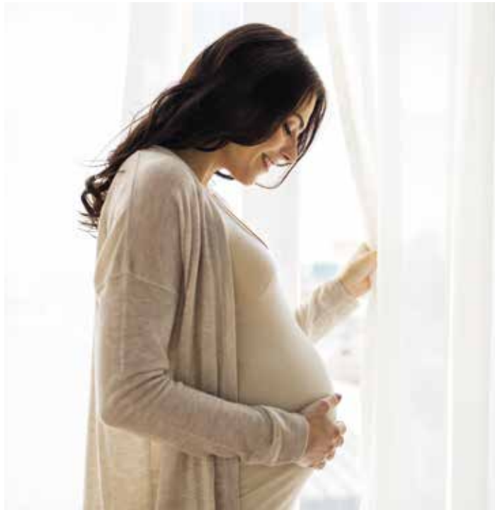
Zum Schutz von Frauen und Kindern ist Leihmutterschaft in Österreich nicht erlaubt.

Gegenwärtig gibt es eine Initiative der Europäischen Kommission zur „Regulierung grenzüberschreitender Anerkennung von Elternschaft“. Nachdem damit ausdrücklich auch Elternschaft durch Leihmutterschaft anerkannt werden soll, bedeutet das eine Legalisierung des Kindeshandels. Bis 13. Februar 2023 konnten die Justizminister/innen der Nationalstaaten zu diesem Plan der EU-Kommission Rückmeldungen geben. Gemeinsam mit der „aktion leben“, der Katholischen Aktion, dem Katholischen Laienrat und der Arbeitsgemeinschaft Katholischer Verbände hat der Katholische Familienverband Justizministerin Alma Zadić und Familienministerin Susanne Raab in einem offenen Brief aufgefordert, der EU-Kommission ihr Nein zur Leihmutterschaft mitzuteilen. Gesetze dürften nicht nach den Wünschen erwachsener Menschen gemacht werden.