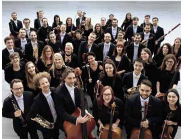
Tolle Konzerte der Philharmonie Salzburg für Ihre Werbe-Unterstützung

Genießen Sie tolle Konzerte der Philharmonie Salzburg.