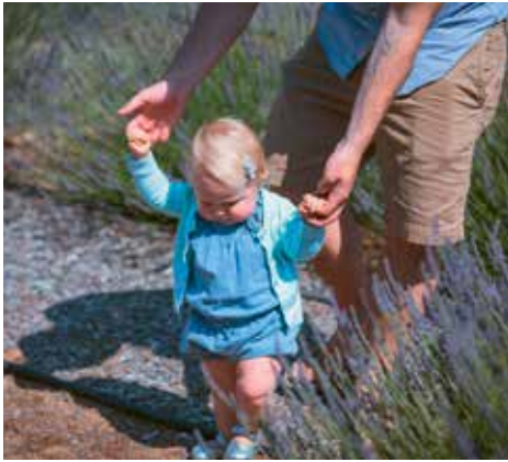
Aktive und präsente Väter sind gefragt.