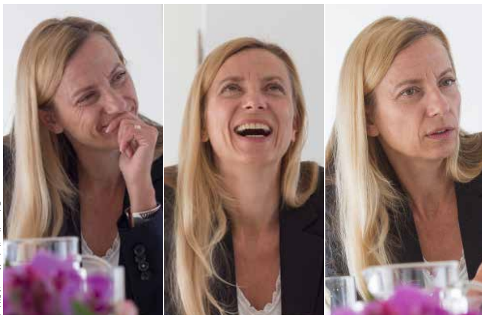
Von der Uni auf die Ministerbank: Neopolitikerin Juliane Bogner-Strauß (ÖVP) ist seit 8. Jänner im Regierungsteam und für die Agenden Frauen, Familien und Jugend zuständig.

Sie sind eine Quereinsteigerin, die von der Uni Graz direkt in den Nationalrat und dann ins Ministeramt gewechselt ist. Warum tun Sie sich das an?