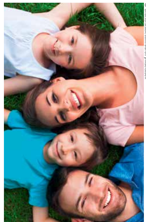
Grund zur Freude mit dem Familienbonus?

Das trifft nicht zu. Bei einem Brutto-Einkommen von 2.000 Euro bleiben nach Abzug der Sozialversicherung und der Lohnsteuer 1.500 Euro netto/Monat. Das bedeutet 2.000 Euro Lohnsteuer pro Jahr. Damit kann der Familienbonus für ein Kind zur Gänze ausgeschöpft werden. Ein Spitzenverdiener mit beispielsweise einem Brutto-Einkommen von 14.000 Euro/Monat zahlt 6.700 Euro Lohnsteuer pro Jahr. Auch er kann nur 1.500 Euro Familienbonus pro Kind geltend machen. Vergleicht man den Familienbonus mit der bisher geltenden Regelung, profitiert die Mittelschicht am meisten.