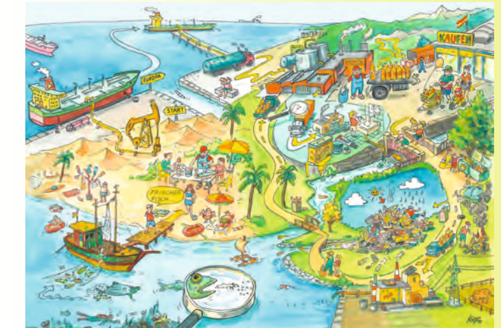
Diese kleine Bild kann dir als Vorlage zum Ausmalen dienen

Zu den Fleisch- oder Allesfressern gehören auch wir Menschen. Das Mikroplastik, das seinen Weg ins Meer findet, gelangt in unsere Nahrung. Fische, die Mikroplastik und die damit verbundenen Giftstoffe in sich aufgenommen haben, kommen über den Lebensmittelhandel auf unsere Teller – nachdem sie mit dem LKW oft durch halb Europa transportiert wurden (Reifenabrieb). Wenn wir diese Fische essen, konsumieren wir mit diesen auch Mikroplastik und die Giftstoffe, die an diesem anhaften.