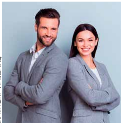
Wenn Familie ein Thema wird – die Entscheidung dafür bedeutet nicht zwingend Verzicht auf Karriere. Geteilte Führung ist eine Lösung.

Geteilte Führung in Teilzeit bringt doppelten Nutzen: Sie ermöglicht Karriere und Familie und rechnet sich für Unternehmen.