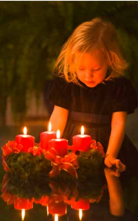
Advent ist die Zeit für Familien.

Weihnachtskekse am Adventsonntag , Kindermette vor der Bescherung oder das familieneigene Krippel: Keine andere Zeit kennt so viele Bräuche und Traditionen wie die Advent- und Weihnachtszeit.