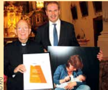
Am Rande der Jahreshauptversammlung, die Ende September in St. Pölten stattfand, bedankte sich Präsident Alfred Trendl bei Bischof Küng für sein Engagement als Familienbischof.

Mit Mai ist Bischof Klaus Küng emeritiert. Fast 30 Jahre lang – von 1989 bis 2019 – war er in der Bischofskonferenz für Familienfragen zuständig und damit in der Kirche erster Ansprechpartner für den Katholischen Familienverband. Als Dank und Anerkennung für seinen großen Einsatz, seine tatkräftige Unterstützung und das jahrelange gute Einvernehmen verlieh der Katholische Familienverband dem Altbischof von St. Pölten die Ehrenmitgliedschaft auf Lebenszeit und überreichte ihm ein Bild aus der Serie „Marias Schwestern“ von Irene Kerntaler-Moser. Neuer „Familienbischof“ ist der Salzburger Erzbischof Franz Lackner. Er ist in der Bischofskonferenz für die Bereiche „Ehe und Familie“ und „Lebensschutz“ zuständig.