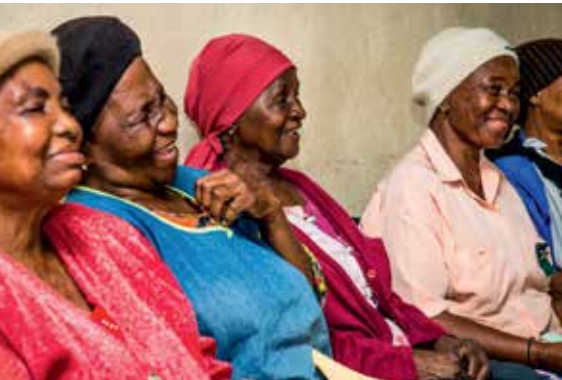
Regelmäßig treffen sich die Frauen zum gegenseitigen Austausch.

Die Kreditnehmerinnen der „The Small Enterprise Foundation“ finden gemeinsam Wege aus der Armut.