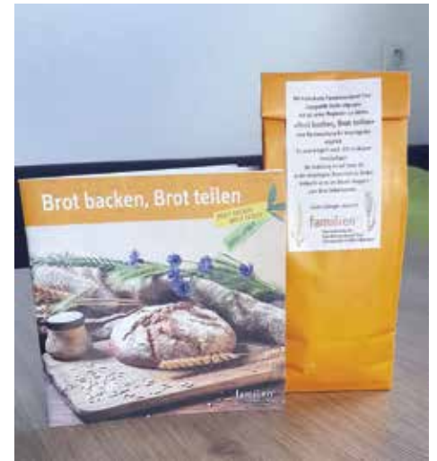
Bild oben: Eine Brotbackmischung für Vinschgerln wurde mit der Brotbroschüre an alle Mitgliedsfamilien verteilt.

Damit die Familien mit Kindern endlich wieder etwas erleben konnten, wurde im Juni 2022 ein Ausflug auf die Burg Heinfels mit Familienführung organisiert. Bei traumhaftem Wetter und ritterlichem Ambiente wurde der Nachmittag mit lehr-