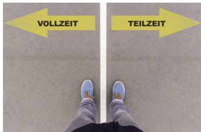
Die Teilzeitquote betrug im Jahr 2021 bei Männern 11,6 Prozent, bei Frauen 49,6 Prozent.

Teilzeitarbeit ist für Eltern mit kleinen Kindern ein zentrales Vereinbarkeitsinstrument. Daher wäre es Aufgabe der Politik, dem Erziehungsauftrag der Eltern und ihrem Wunsch, Teilzeit zu arbeiten, nachzukommen und entsprechende