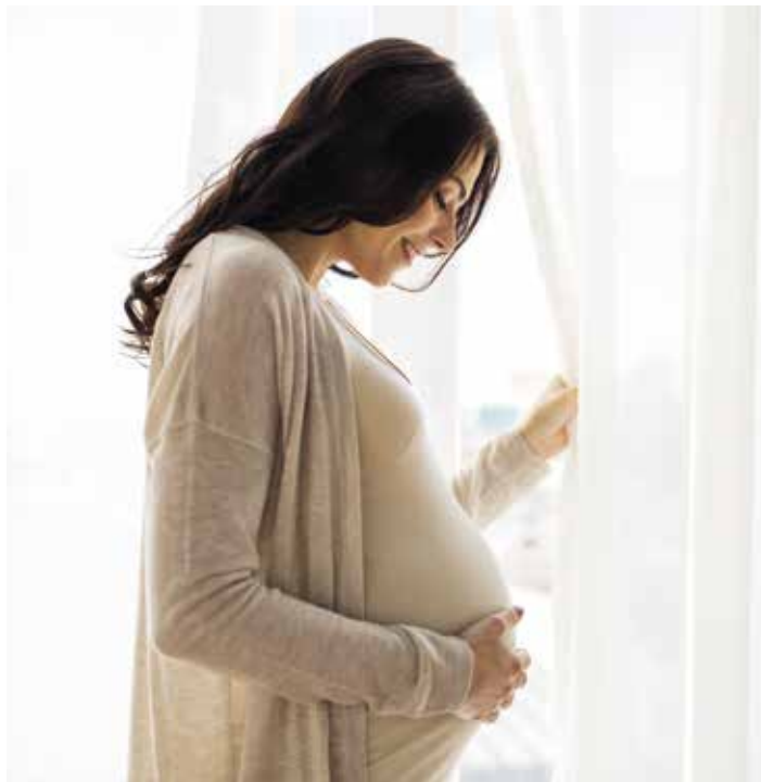
Zum Schutz von Frauen und Kindern ist Leihmutterschaft in Österreich nicht erlaubt.

Gegenwärtig gibt es eine Initiative der Europäischen Kommission zur „Regulierung grenzüberschreitender Anerkennung von Elternschaft“. Nachdem damit ausdrücklich auch Elternschaft durch Leihmutterschaft anerkannt werden soll, bedeutet das eine Legalisierung des Kindeshandels. Bis 13. Februar 2023 konnten die Justizminister/innen der Nationalstaaten zu diesem Plan der EU-Kommission Rückmeldungen geben. Gemeinsam mit der „aktion leben“, der Katholischen Aktion, dem Katholischen Laienrat und der Arbeitsgemeinschaft Katholischer Verbände hat der Katholische Familienverband Justizministerin Alma Zadić und Familienministerin Susanne Raab in einem offenen Brief aufgefordert, der EU-Kommission ihr Nein zur Leihmutterschaft mitzuteilen. Gesetze dürften nicht nach den Wünschen erwachsener Menschen gemacht werden.