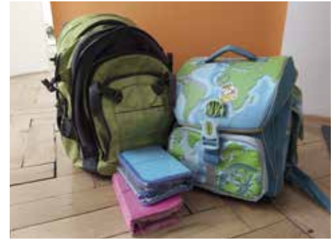
Der Katholische Familienverband hat für aus der Ukraine geflüchtete Schüler/innen Schultaschen und Schreibsachen gesammelt. Wir bedanken uns für die zahlreichen gespendeten Schulsachen!

Dabei hilft es oft, selbst eine Medienpause einzulegen. Suchen Sie sich ein Medium, dem Sie vertrauen und versuchen Sie, sich nur ein- oder zweimal am Tag kurz zu informieren, anstatt Medien in einer Dauerschleife zu konsumieren. Vorsicht vor Fake News! Eine gute Quelle, um Nachrichten einzuschätzen, ist das Online-Tool von www.mimikama.at . Es erlaubt, Nachrichten auf ihren Wahrheitsgehalt zu überprüfen.