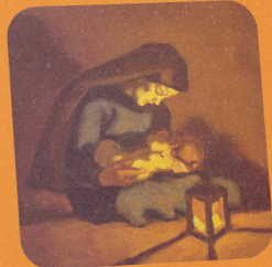
Geborgenheit und Licht