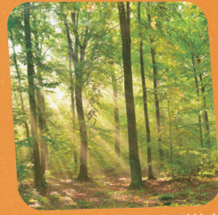
Entdeckungsreise im Wald