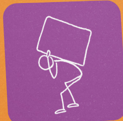
8 Schritte zur Entlastung