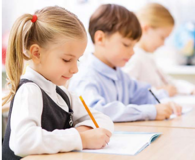
Das Coronavirus verändert auch den Schulalltag. Die Klassen müssen im Mai und Juni halb leer bleiben.

möglichst gering zu halten und das Abstandhalten zu erleichtern, soll es zu einer „Verdünnung“ der Klassen kommen. Die Klassen werden geteilt und an unterschiedlichen Tagen unterrichtet. Die Hälfte der Schüler/innen geht von Montag bis Mittwoch in die Schule, die andere Hälfte Donnerstag und Freitag. Die Woche darauf wird gewechselt. Der Unterricht soll möglichst nach dem regulären Stundenplan stattfinden, Turnen und Musik finden nicht statt. In den Volksschulen wird das Sitzenbleiben ausgesetzt, an allen anderen Schulen soll man mit einem Fünfer automatisch aufsteigen können und Schularbeiten finden keine mehr statt. Die Basis für das Jahreszeugnis bilden die Noten des Semesterzeugnisses sowie die Leistungen bis zum 16. 3.2020. Die Leistungen während des Home-Schooling und des nun folgenden tageweisen Unterrichts in der Schule werden als Mitarbeit gewertet. Bildungsschere ist aufgegangen. „Es darf in diesem Schuljahr keine Corona-Verlierer geben“, forderte Vizepräsidentin Astrid