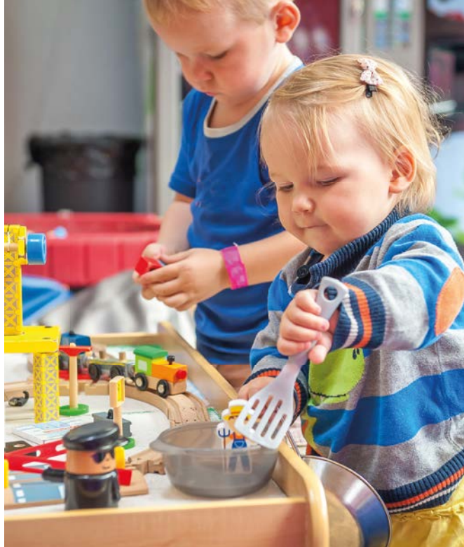
Im Jahr 2018 waren österreichweit 98,2 Prozent der 5-jährigen Kinder in Betreuung; 97,5 Prozent besuchten einen Kindergarten; 0,7 Prozent wurden vorzeitig eingeschult.

„Wenn schon von ‚Heldinnen des Alltags‘ gesprochen wird, so ist dieser Ausdruck zuallererst auf Eltern anzuwenden“, betont Alfred Trendl, Präsident des Katholischen Familienverbandes angesichts dieser enormen Leistung, die von Familien während der Corona-Krise für die gesamte Gesellschaft erbracht wurde. Besonders problematisch war bzw. ist es für Eltern die arbeiten mussten, deren Beruf aber nicht als systemrelevant galt. Es kam immer wieder vor, dass Eltern, die ihre Kinder in die Notbetreuung geben wollten, abgewiesen wurden.