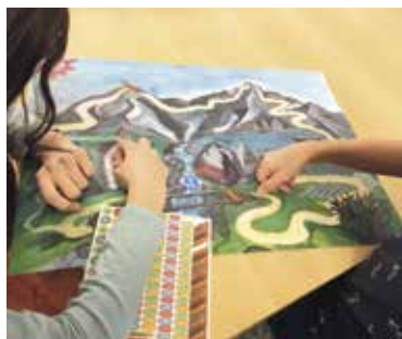
Mit unserem Plakat durch die Fastenzeit

Unter dem Motto „Gutes verbinden“ haben wir heuer erstmalig unsere Aktion plusminus in das Projekt Gutes Leben integriert und bieten nun tägliche Impulstexte, Aktionen zum Mitmachen in der Fastenzeit sowie Ideen für Feierlichkeiten in der Karwoche für Familien, Kindergruppen und Einzelpersonen.