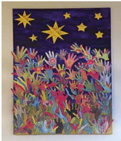
Bild links: Bunt und vielseitig – das Team des Familienverbandes Mieders