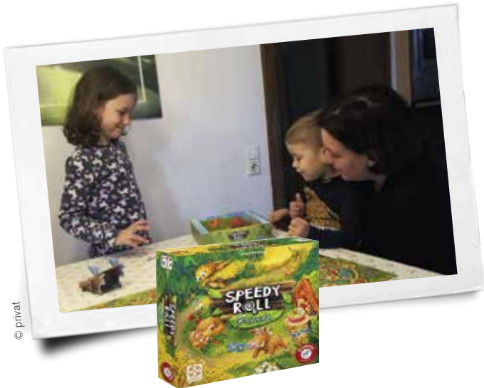
Speedy Roll & Friends

Speedy Roll & Friends, ein kooperatives Familienspiel.